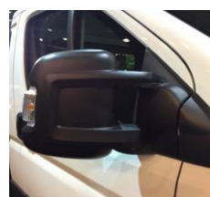
↑ стандартні зовнішні дзеркала.